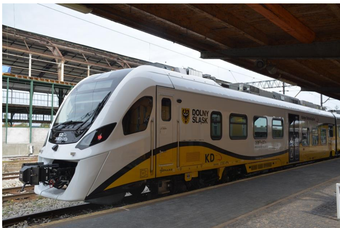
Zdjęcie 12. Elektryczny zespół trakcyjny – 36WEh