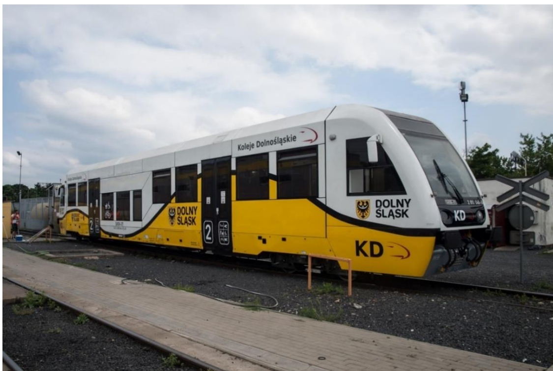
Zdjęcie 7. Spalinowy zespół trakcyjny – SA106